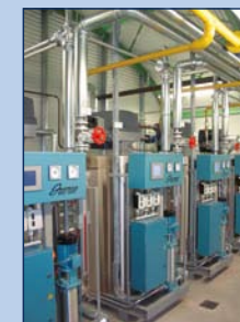
JUMAG Mehrfach-Dampf-Anlage MDA

Die angegebenen Daten gelten in Verbindung mit dem Abgas-Economiser und einer Speisewassertemperatur von 95°C und 6 barÜ Arbeitsdruck. * Öl-EL: Hu = 11,86 kWh/kg ** Erdgas: Hu = 10,35 kWh/m 3